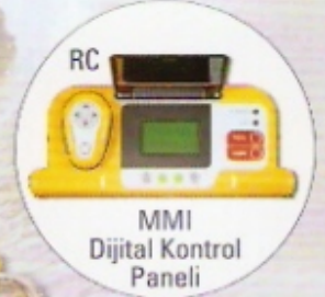
MMI Dijital Kontrol Paneli

60 m. uzunluğa kadar umuma açık havuzlar için tavsiye edilir.