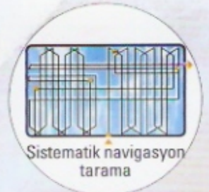
Sistematik navigasyon tarama